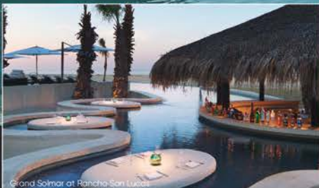
Grand Solmar at Rancho San Lucas