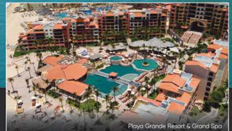
Playa Grande Resort & Grand Spa