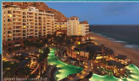
Grand Solmar Land's End