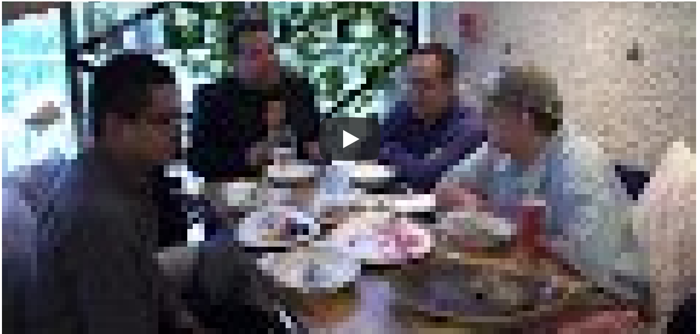
PRIMER SHOW DE LA MAGIA DEL PODER EN JUEBEBES 2DA PARTE.