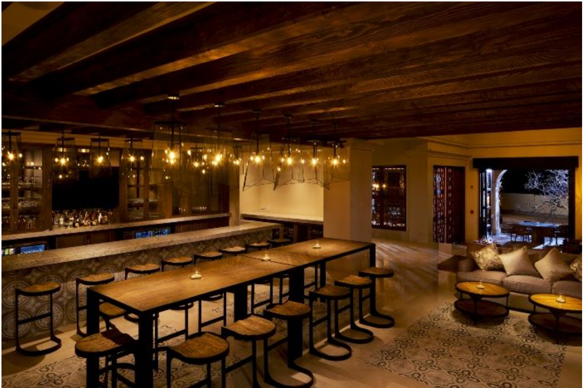
Anicá. Uno de los resurantes con los que cuenta el resort, donde se equilibra el sabor.

Si piensas en unas vacaciones especiales (aniversario, Luna de miel o darse un gusto), entonces hay algo dentro del complejo antes mencionado que debes conocer: Grand Solmar at Rancho San Lucas Resort Golf & Spa (Carretera Todos Santos Km 120 1).